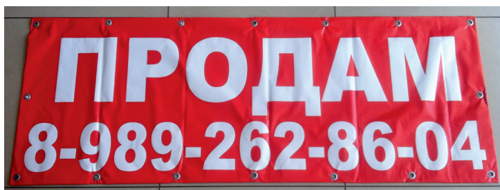
как должна выглядеть готовая продукция