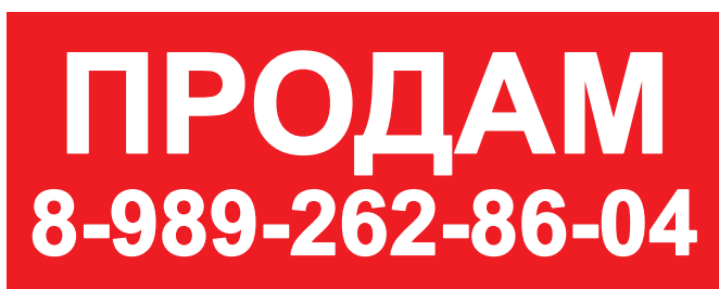
проклейка и люверсы по периметру, 2 шт, 720dpi