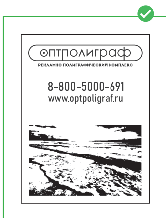
Правильно подготовленный макет Растровое изображение черно-белое