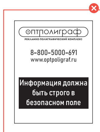
Неправильно подготовленный макет Большие черные плашки в макете