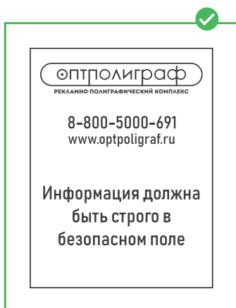
Правильно подготовленный макет Без больших черных плашек.