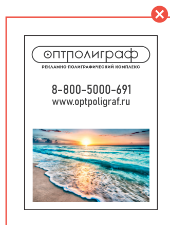
Неправильно подготовленный макет Цветное растровое изображение