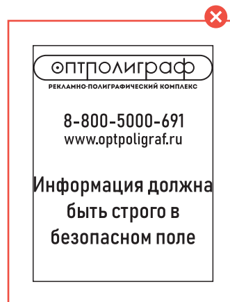
Неправильно подготовленный макет Информация расположена близко к краям макета. Часть текста не пропечатается. Черный текст 0.0.0.100