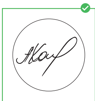
Правильный макет толщина линий более 0,2мм

Линии должны быть объединены в единый объект.