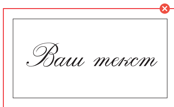
Тонкий текст, тонкие линии