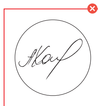
Неправильный макет толщина линий менее 0,2мм